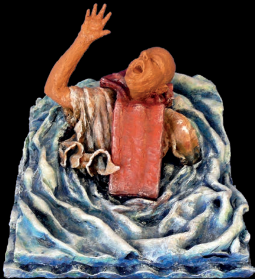
Serie L'approdo | n° 10