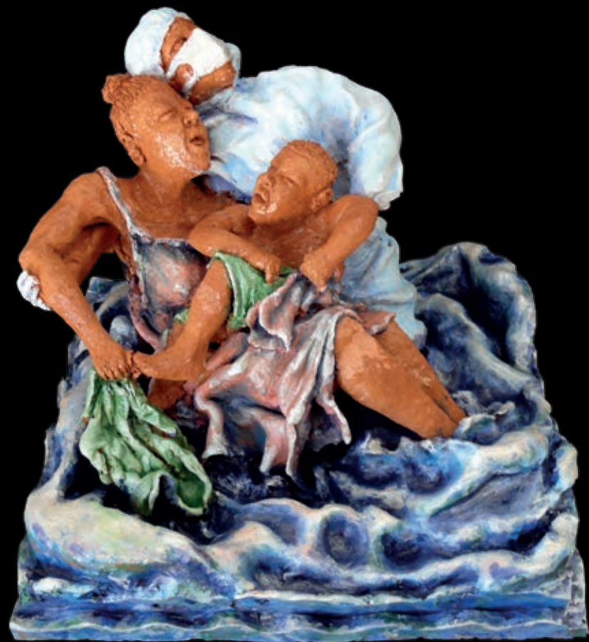
Serie L'approdo | n° 5