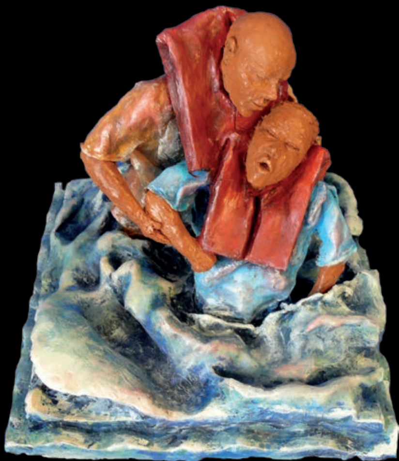
Serie L'approdo | n° 14