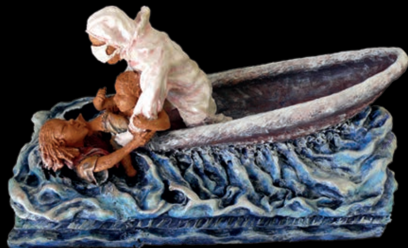
Serie L'approdo | n° 9