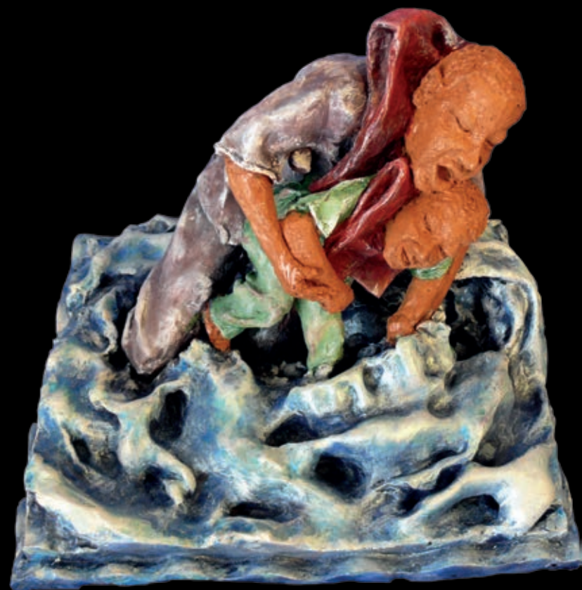
Serie L'approdo | n° 13