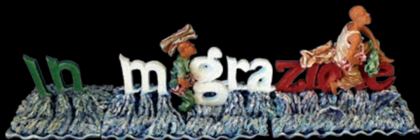
Serie L'approdo | n° 8