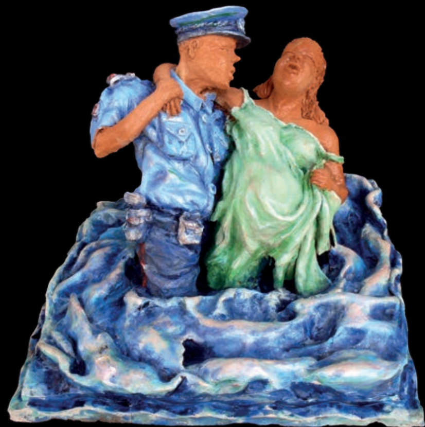
Serie L'approdo | n° 3