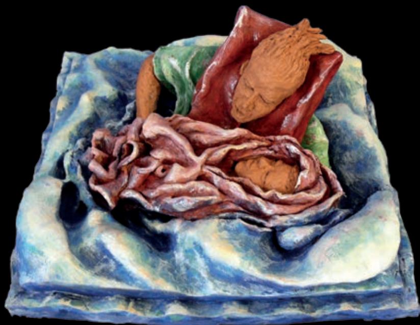
Serie L'approdo | n° 12