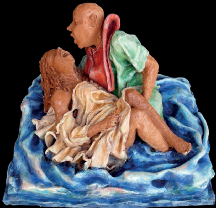
Serie L'approdo | n° 4