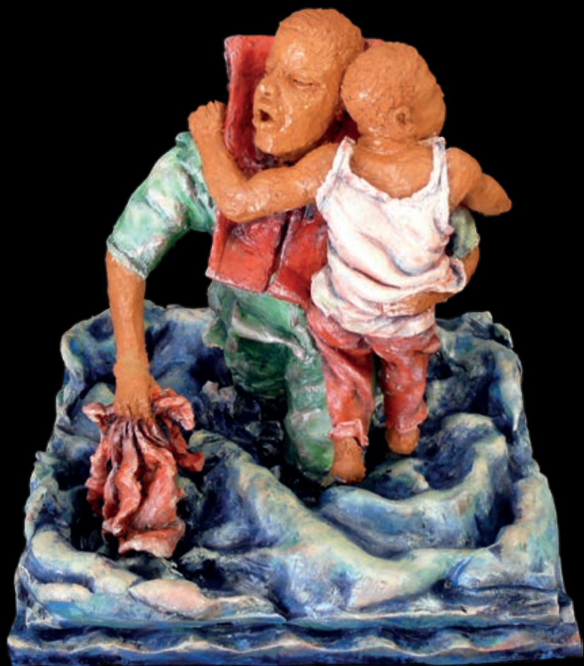
Serie L'approdo | n° 6