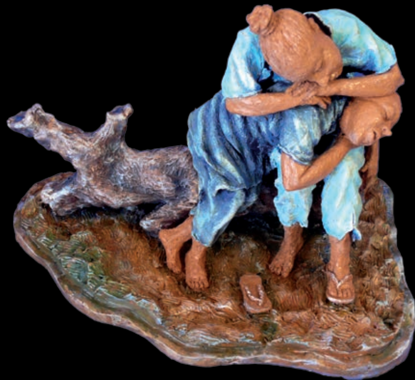
Serie L'approdo | n° 11